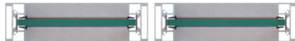
ΑΠΟΣΠΩΜΕΝΗΣ ΤΟΠΟΘΕΤΗΣΗΣ / DETACHABLE INSTALLATION

Windbreak system for the enclosure of outdoor spaces - particularly restaurants and cafeterias, of either permanent or temporary installation. In the case of the former, a single column is used between adjacent systems, while, to facilitate removal in the summer, a double column is employed.